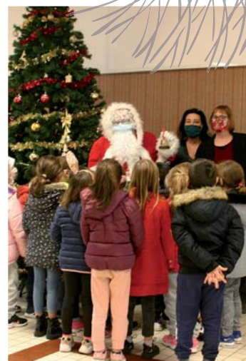
Le Noël des enfants à la cantine

Nous aimerions ainsi que la rentrée 2021 voie se constituer un Conseil Municipal des Enfants qui leur permettra de faire entendre leur parole dans l'intérêt de tous. Ce projet inscrit dans nos engagements électoraux prendra forme avec l'aide d'encadrants volontaires (parents, enseignants...) que nous sensibiliserons à ce projet dès ce printemps.