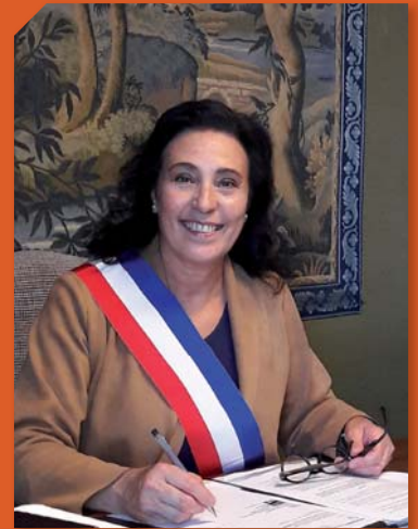
Madame Le Maire, Laurence Le Roy

Unis, nous avons des forces insoupçonnées, solidement attachées à nos valeurs de solidarité, de proximité, d'écoute, de dialogue, de bien-vivre ensemble, de respect de l'environnement. La mobilisation de mon équipe et la capacité de tous à s'adapter sont des raisons d'espérer, pour les mois à venir, de pouvoir se retrouver, de partager sans peur mais plutôt avec sérénité.