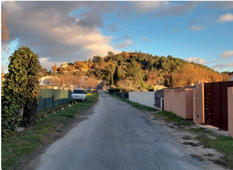
Vue générale colline du Fort