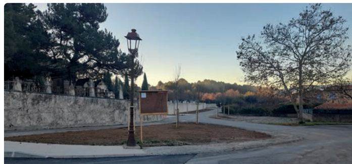
Parking du cimetière