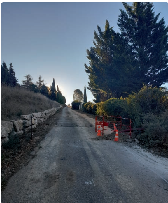
Montée du Fort

Leur inhumation fera l'objet d'une cérémonie en hommage à nos aïeux.