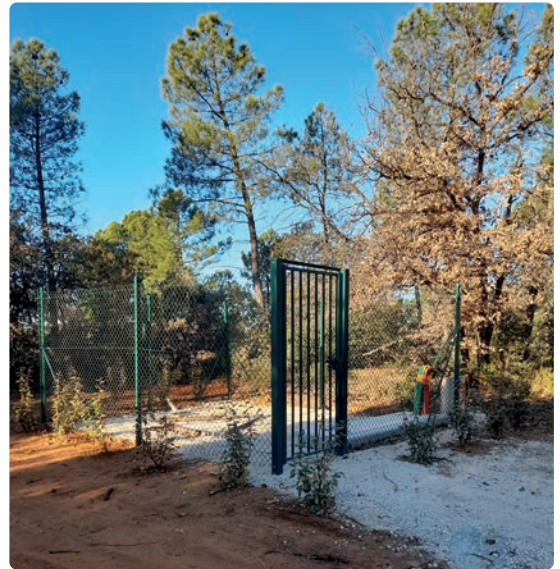
Aménagement antenne Mines de Bruoux

Suite à la découverte d'ossements lors du terrassement du socle de l'antenne, j'ai envoyé sur place le 15 mai 2024 au matin notre garde-champêtre pour arrêter les travaux. La gendarmerie d'Apt est aussi intervenue pour faire évacuer le site. J'ai ensuite prévenu la DRAC (Direction Régionale des Affaires Culturelles) afin qu'elle procède à des fouilles. Celles-ci ont été réalisées fin juillet. La DRAC a par la suite autorisé l'entreprise AXIONE à reprendre les travaux. Avant que ceux-ci redémarrent, j'ai demandé aux propriétaires de collecter les ossements découverts, en présence du garde-champêtre et en plein accord avec eux. Ces derniers ont été entreposés provisoirement à l'ossuaire municipal du cimetière et retrouveront leur place originelle après la fin du chantier, dans un lieu choisi par les propriétaires.