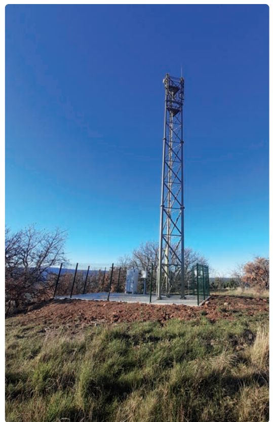
Site de l'antenne du Fort