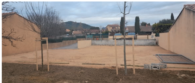
Parking de la Cerisaie