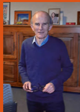
Belle et bonne année.

Alors que mon mandat de maire arrive à son terme, je garderai le souvenir des moments partagés avec vous et de l'engagement collectif pour le bien de notre commune et l'intérêt général. Ce fut un honneur de contribuer, à mon humble place, au service de notre communauté et de voir se concrétiser de nombreux projets pour le bien commun.